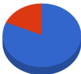
Distribuição por Segmento

Os valores constantes na planilha de enquadramento referem-se apenas aos valores aplicados em fundos de investimentos e não em saldos disponíveis em conta corrente.