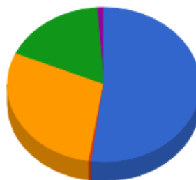
Distribuição por Artigos

● 7º I b ● 7º III a ● 7º IV a ● 8º II a ● 8º III