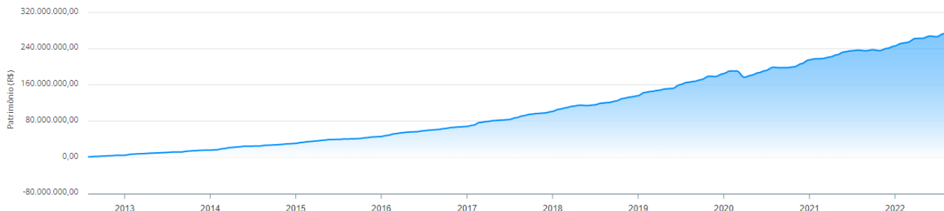
Evolução do Patrimônio