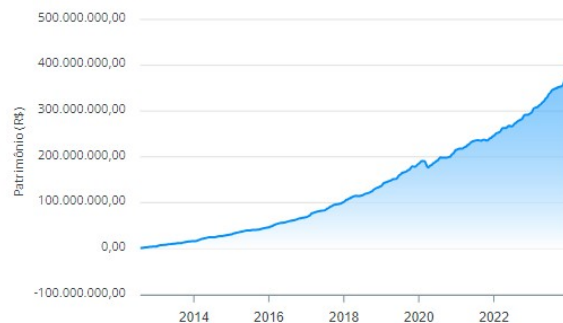
Evolução do Patrimônio