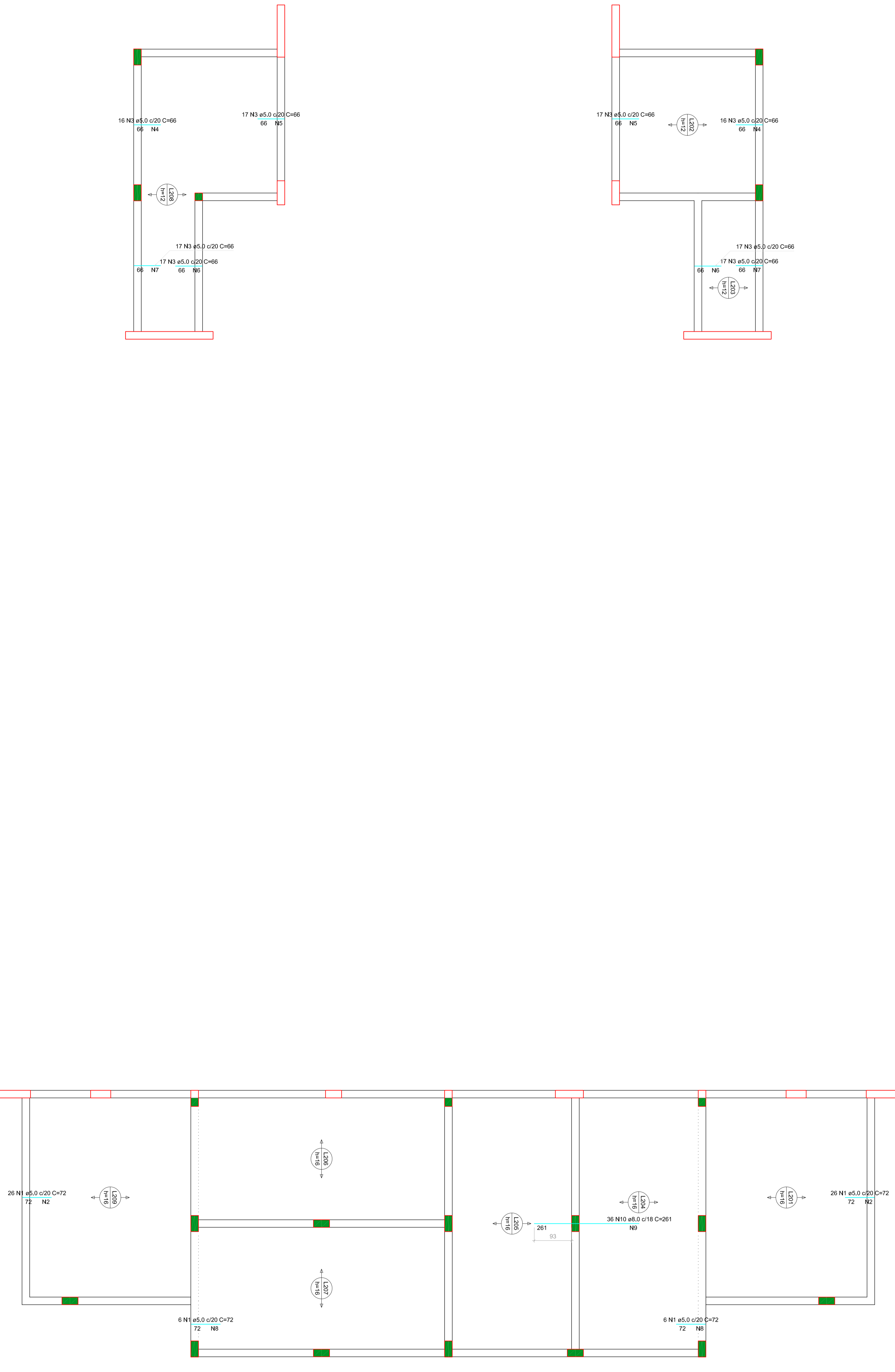
Armação negativa das lajes do pavimento Laje dos banheiros (Eixo Y) escala 1:50