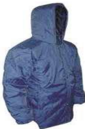
Figura ilustrativa do Casaco Térmico

Casaco térmico, tipo japonsa ou blusão térmico confeccionada em 100% nylon resinado; modelo unissex; na cor Azul Royal , com forro em manta de proteção térmica e antialérgica; matéria prima do forro em poliéster; com gola tipo capuz; com 2 bolsos frontais externos embutidos nas laterais e um interno; fechamento através de velcro alinhado por botão guia e barra lisa sendo o fechamento frontal até o pescoço; mangas compridas; no lado esquerdo do peito deve ser bordado o Brasão do Município de Jaguariúna nas cores originais e abaixo a escrita “Secretaria de Meio Ambiente” na cor amarelo ouro, com dimensões 9cm x 7cm, nos tamanhos P ao EXGG.