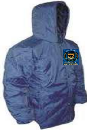
Figura ilustrativa do Casaco Térmico

Departamento de Licitações e Contratos Rua Alfredo Bueno, 1235 - Centro – Jaguariúna - SP – CEP: 13.910-027 Fone: (19) 3867 9825 / 9757 / 9792 / 9801 / 9707 / 9780 www.licitacoes.jaguariuna.sp.gov.br