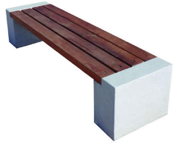
Detalhe modelo do banco sem escala