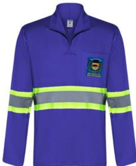
Figura ilustrativa da Camisa Polo manga Longa com Faixas Retro Refletivas

Departamento de Licitações e Contratos Rua Alfredo Bueno, 1235 - Centro – Jaguariúna - SP – CEP: 13.910-027 Fone: (19) 3867 9825 / 9757 / 9792 / 9801 / 9707 / 9780 www.licitacoes.jaguariuna.sp.gov.br