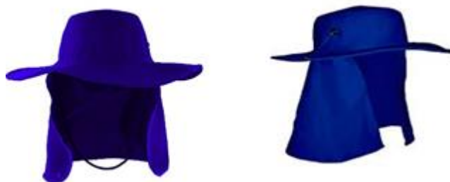
Figura ilustrativa do Chapéu Árabe

- Na parte frontal do chapéu deve ser bordado o Brasão do Município de Jaguariúna nas cores originais e abaixo a escrita “Secretaria de Meio Ambiente” na cor amarelo ouro, com dimensões 5,5cm x 3,5cm.