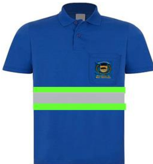
Figura ilustrativa da Camisa Polo manga Curta com Faixas Retro Refletivas

- Embalagem coletiva em caixa de papelão com as devidas identificações.