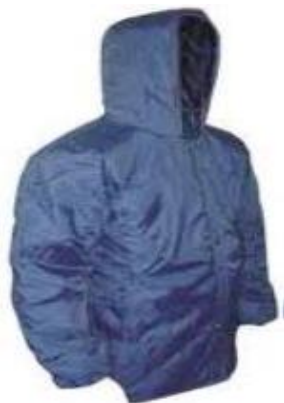
Figura ilustrativa do Casaco Térmico