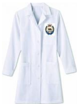
Figura ilustrativa do Jaleco