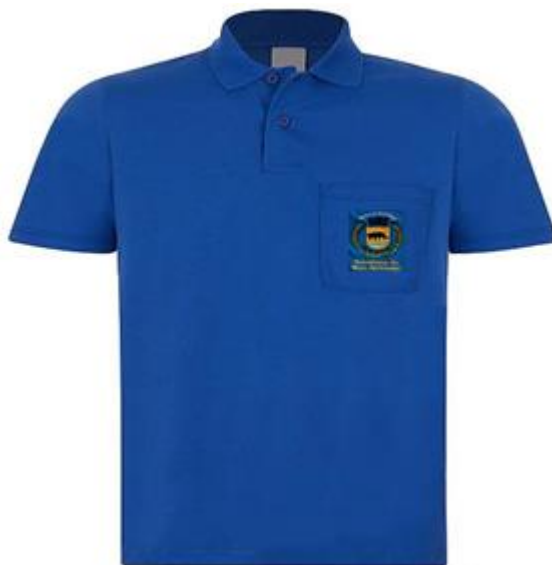
Figura ilustrativa da Camisa Polo manga Curta

- Embalagem coletiva em caixa de papelão com as devidas identificações.