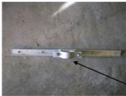
Braçadeira (meia-lua) de 3”