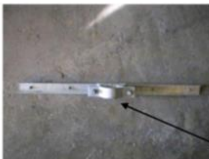
Braçadeira (meia-lua) de 4”